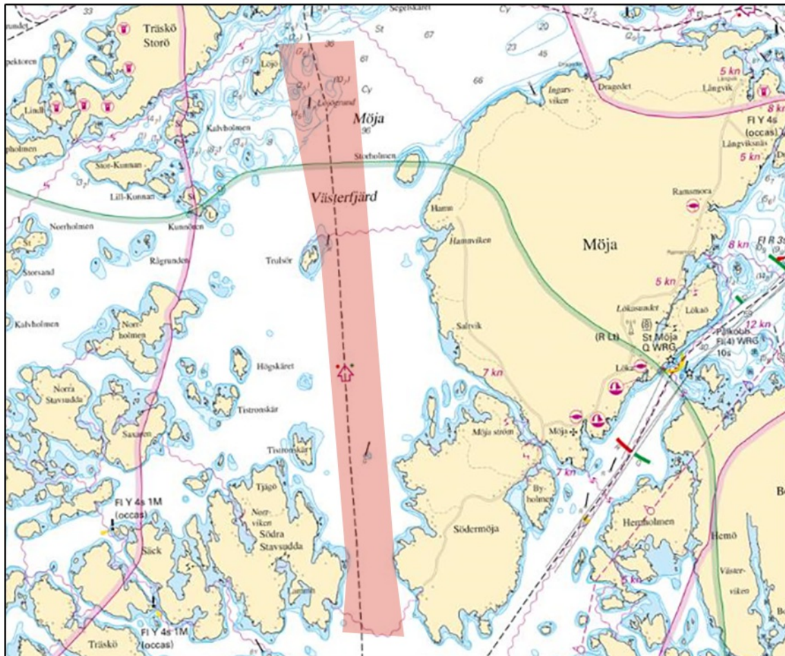
Förbud mot brytande av isränna Möja Västerfjärd

BSP Stockholm M 2022/s19, Bsp Stockholm N 2022/s40, s45